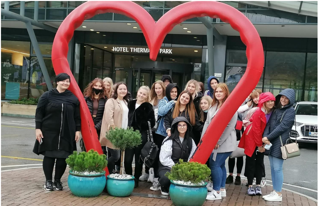
Skupinska slika pred Thermana Laško.