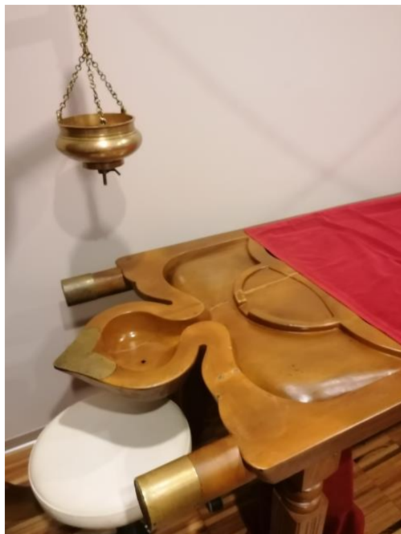
masažna miza za indijsko masažo