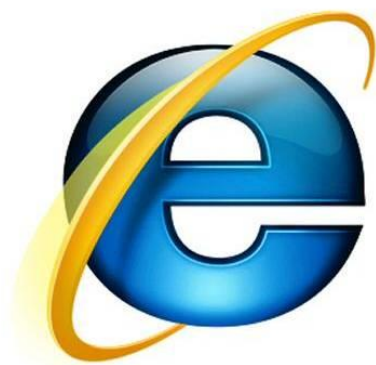
Slika 1 Uporabiti moraš vsaj tri različne internetne vire

Za popestritev in dopolnjevanje informacij poiščemo še elektronske vire gradiva (CD-ROM, internet ali podatkovne zbirke s polnimi besedili).