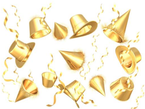
Slika 4 Praznovanje ob zaključku dela

Tudi tu ne smemo biti predolgi in se omejimo na polovico strani. Zaključek zapišemo čisto na koncu in si potem dobro oddahnemo, saj je naše delo skoraj pri koncu.