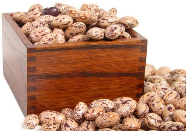
Slika 3 Prebiranje fižola

Pogosto se poraja vprašanje, kje naj začnemo. Če se zatakne že pri uvodu, pustimo tega za kasneje in začnemo pisati katerokoli poglavje. Pomembno pa je, da podatke, ki jih zapisujemo v računalnik, sproti shranjujemo, in ne oblikujemo . Z obliko se bomo ukvarjali čisto na koncu, ko bomo imeli večino informacij že vnešenih. Ne smemo pa zanemarjati tega koraka, saj nam bo oblika vzela kar precej časa.